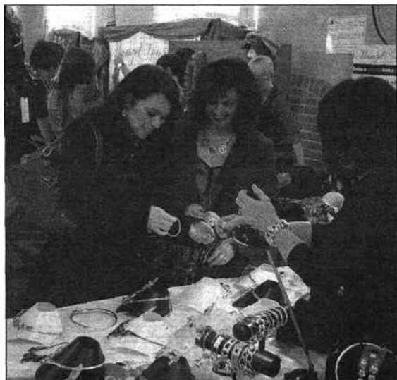
Un petit bijou ?

■ L'association Top tendances a organisé dimanche son 2° salon, à la salle des fêtes. Encore une fois, il a connu un franc succès, avec plus de 1 200 entrées.