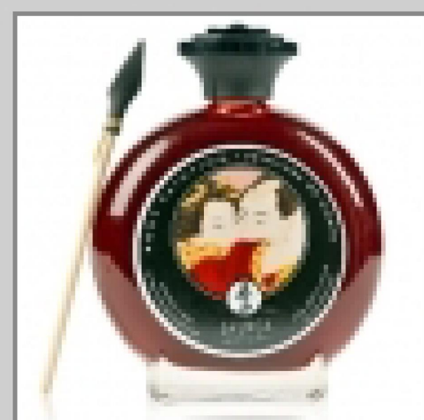
Secrète Arlette : quand la peinture se fait sextoy