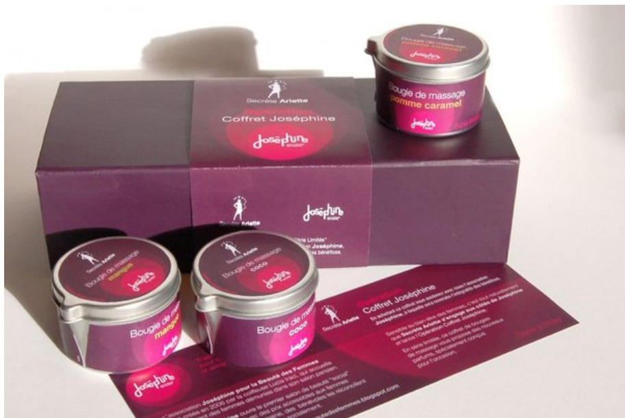
Le coffret Joséphine.

Imprimer | Envoyer par e-mail | Partager | Voter (0) | Commenter (0)